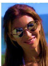
Marian Suplente 1 Cría