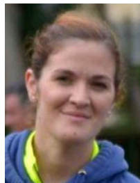
Andrea Comunicación y Juventud