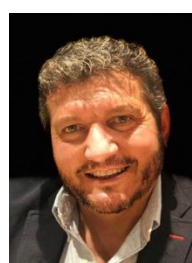
Jorge Suplente 2 Cría