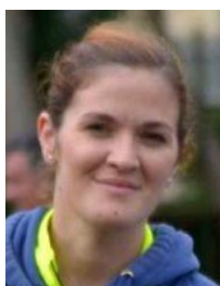
Andrea Comunicación y Juventud