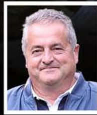
MANUEL TORREBLANCA JUEZ DE PROTECCIÓN (C)